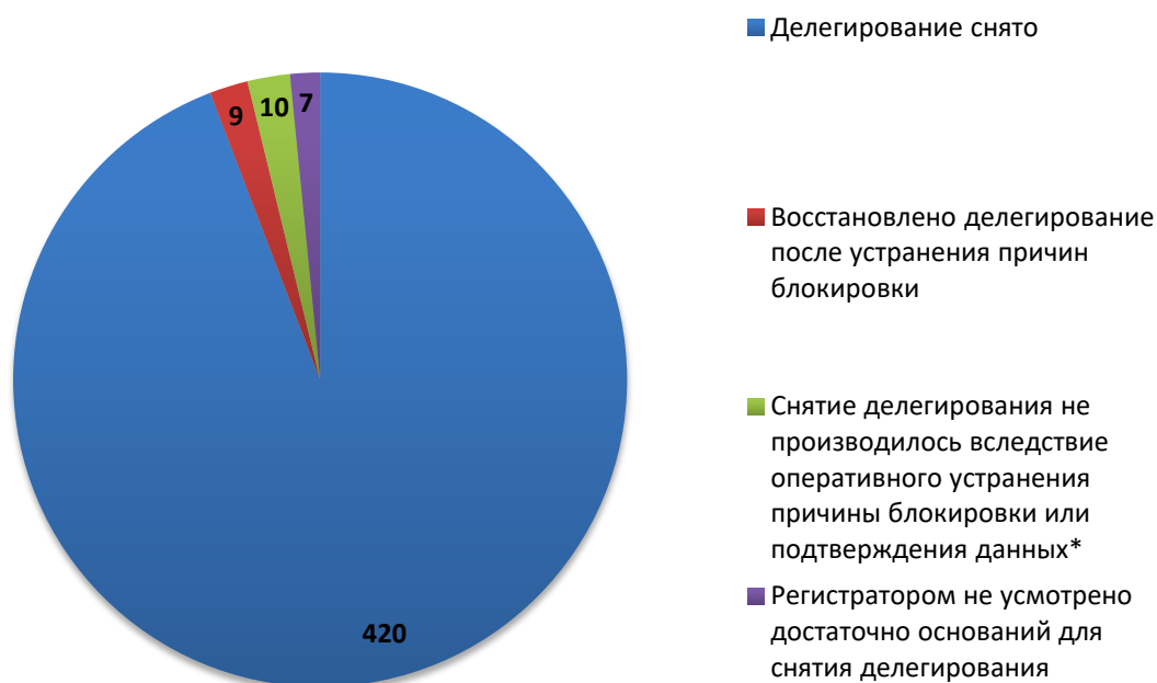
Рис.3 Итоги обработки обращений о снятии делегирования (март 2019)

За отчетный период по обращениям компетентных организаций были сняты с делегирования 429 доменных имен. Для 10 доменных имен снятие делегирования не потребовалось вследствие оперативного устранения причин блокировки администратором домена (или ресурс был заблокирован хостинг-провайдером) или своевременного подтверждения администратором домена идентификационных данных. В 7 случаях, регистратором не усмотрено достаточно оснований для снятия делегирования или инициирования проверки администратора.